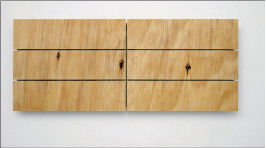
THOMAS VINSON, „To D. Judd“, 2008, Sperrholz, 22 x 55 x 1,9 cm.

hauer, der hier sozusagen die Fortsetzung der Skulptur mit anderen Mitteln praktiziert. Denn die Linien, die geraden Striche waren als Schnitte im Material schon immer da. Sie waren/sind die Trennungslinien zwischen den Modulen, aus denen er seine Skulpturen und Reliefs zusammensetzt. Markus Lepper spricht augenzwinkernd von der „Lücke im Bildkörper“. Warum nicht: Ausgehend von der Plas-